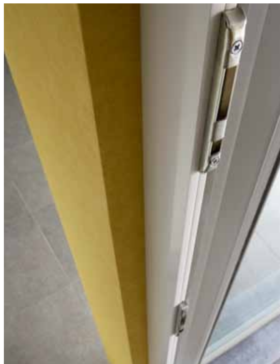
Des fermetures multipoints pour une sécurité accrue.

Les portes coulissantes Monorail sont solides et requièrent peu d'entretien. Pour une étanchéité absolue au vent et à l'eau, Deceuninck y ajoute encore un ingénieux système d'évacuation d'eau et un tout nouveau système de profilé et d'étanchéité.