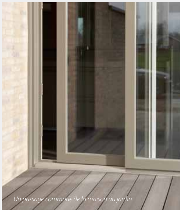
Un passage commode de la maison au jardin